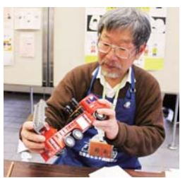
子どもの味方、おもちゃ病院