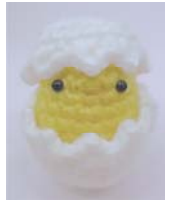
編みぐるみは3×5cm程度

*申込開始日9時30分に定員を超えた場合はその場で抽選し、募集を終了します ①イースターエッグの編みぐるみ 3月16日(水)13時~16時 成人(かぎ針で細編みができる人) 各8人 ¥500円 持毛糸用かぎ針5号、毛糸用とじ針 2月12日9時30分から 窓(☎は13時から)