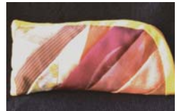
数種類の和布を縫い合わせて作ります

②和布で作るめがねケース 3月14日(月)13時~16時 成人 各10人 ¥500円 持裁縫道具 2月14日9時30分から 窓(☎は13時から)