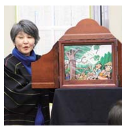
近年、人気復活の紙芝居