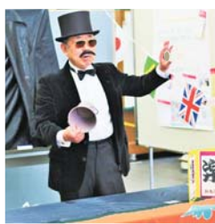
不思議で笑えるマジック